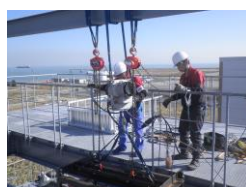
屋外テストタワー 検証設営