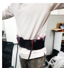
ウェアラブルな触覚情報 提示装置(ベルト型)