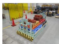
水平搬送技術 (電動台車)