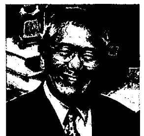
故 根岸 英一 氏 帝人久村奨学生第5回生(1957年)

そして自らの「夢」を見つけたら真理を突き詰めるまで、とことんチャレンジしてください。今後の皆さんの大いなる活躍に期待しています。